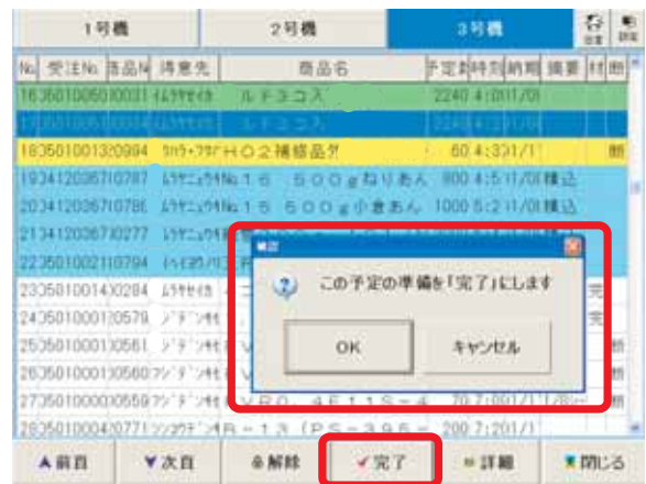
↑ 完了ボタン押下時

コルゲータの原紙掛け予定の表示、製函工程の材料の搬入、出荷時における製品のチェック等、幅広い作業に有効なツールとなるでしょう。